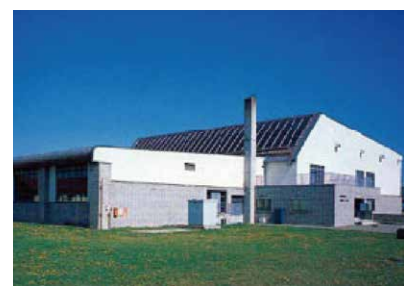
★阿寒町スポーツセンター