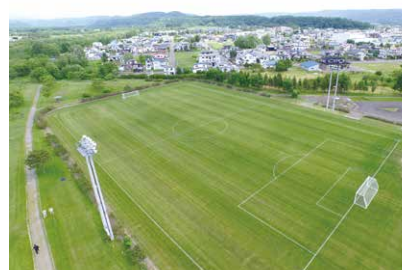
阿寒町多目的広場