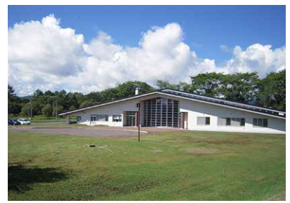
布伏内コミュニティセンター