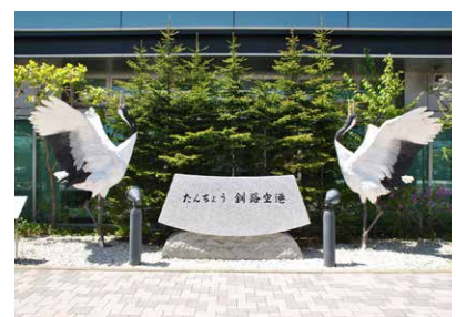
たんちょう釧路空港(★から13km)