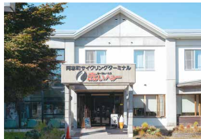
丹頂の里温泉赤いベレー(★から4.2km)