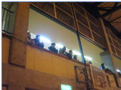
応援のため訪れた父兄