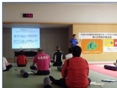
コーディネーショントレーニングライセンス